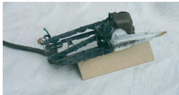
Diese überlastete Tischsteckdose verursachte einen Küchenbrand

Sie müssen zwecks Vermeidung von Wärmestau „offen“ sprich zugänglich betrieben werden, so dass entstehende Wärme abgeführt wird.